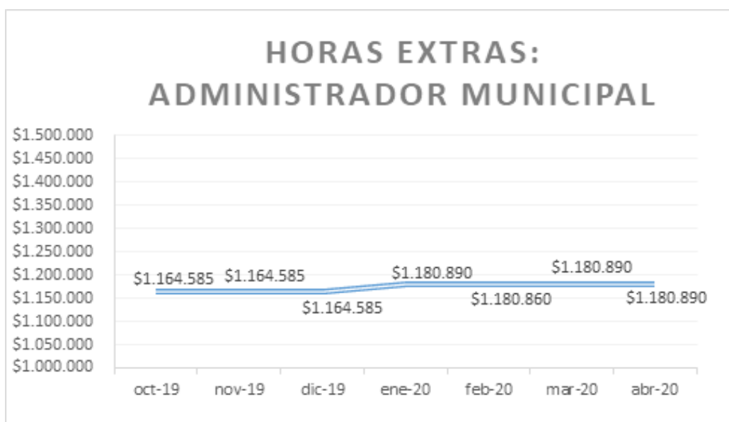
Elaboración propia con datos obtenidos en el portal de transparencia activa, 2020.

Lo señalado anteriormente ha sido continuo y reiterado en el tiempo, y no cambió incluso en pleno estallido social y pandemia por Covid-19: